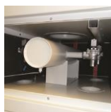
Rensning med tryckluft